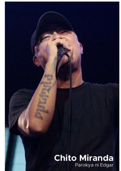
Chito Miranda Parokya ni Edgar